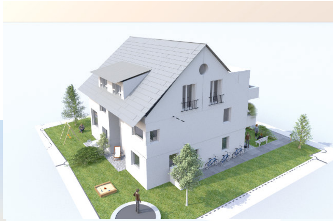
Ansicht Nord-West mit neuen Gauben im Süden und Balkonen (in Kostenkalkulation nicht enthalten)