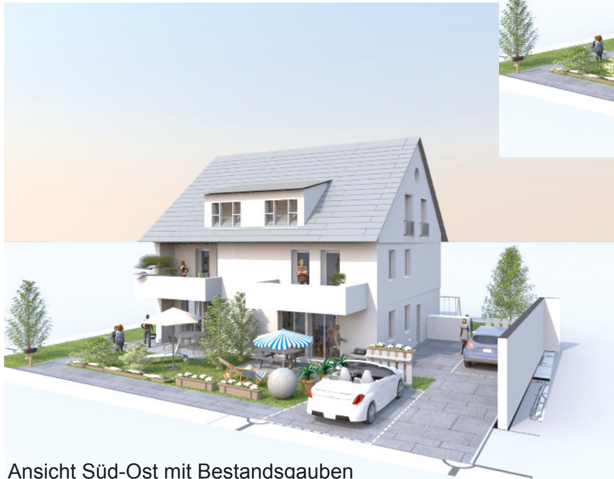
Ansicht Süd-Ost mit Bestandsgauben

Umbau Bestandsgebäude in 2 DHH Söflingen