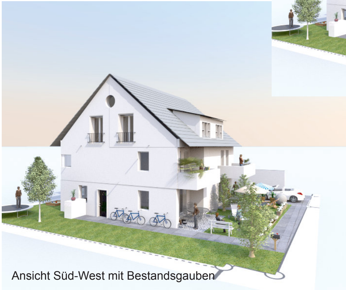
Ansicht Süd-West mit Bestandsgauben

Umbau Bestandsgebäude in 2 DHH Söflingen