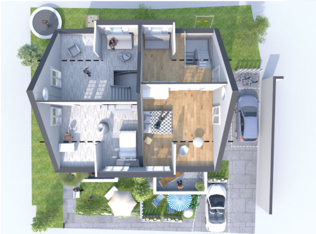
DG mit Bestandsgauben