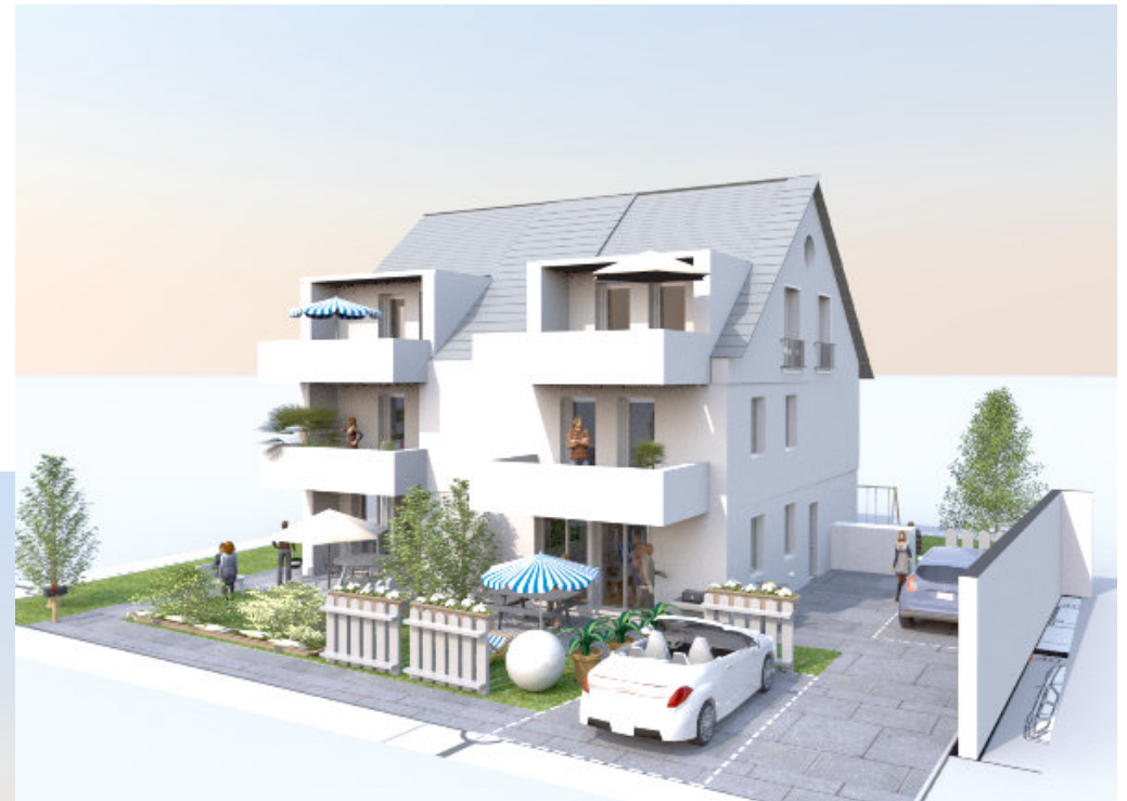
Ansicht Süd-Ost mit neuen Gauben im Süden und Balkonen (in Kostenkalkulation nicht enthalten)