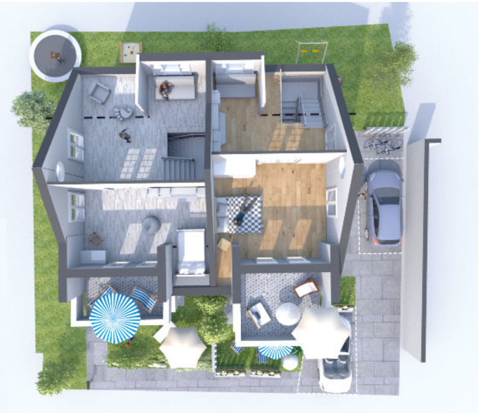
DG mit neuen Gauben im Süden und Balkonen (in Kostenkalkulation nicht enthalten)

Umbau Bestandsgebäude in 2 DHH Söflingen