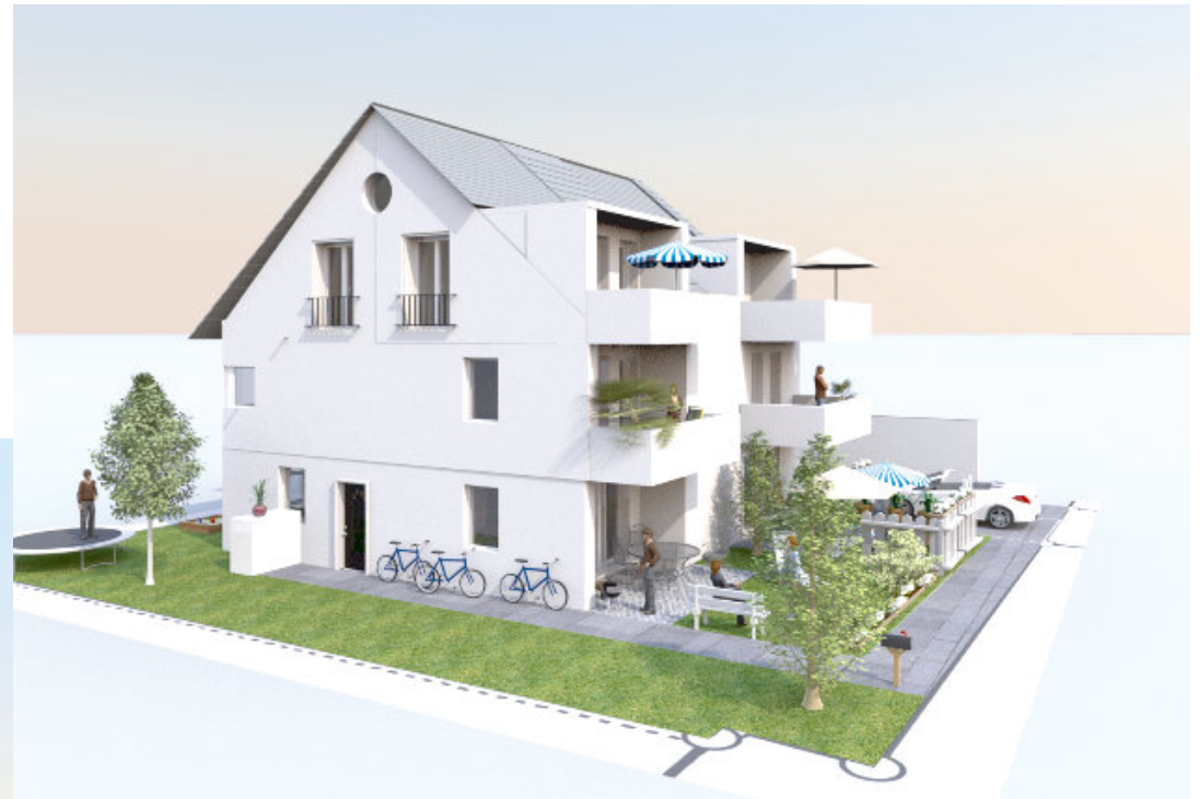
Ansicht Süd-West mit neuen Gauben im Süden und Balkonen (in Kostenkalkulation nicht enthalten)