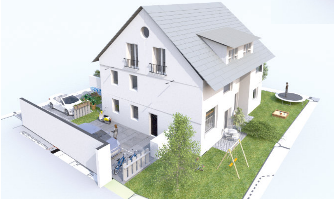
Ansicht Nord-Ost mit Bestandsgauben

Umbau Bestandsgebäude in 2 DHH Söflingen