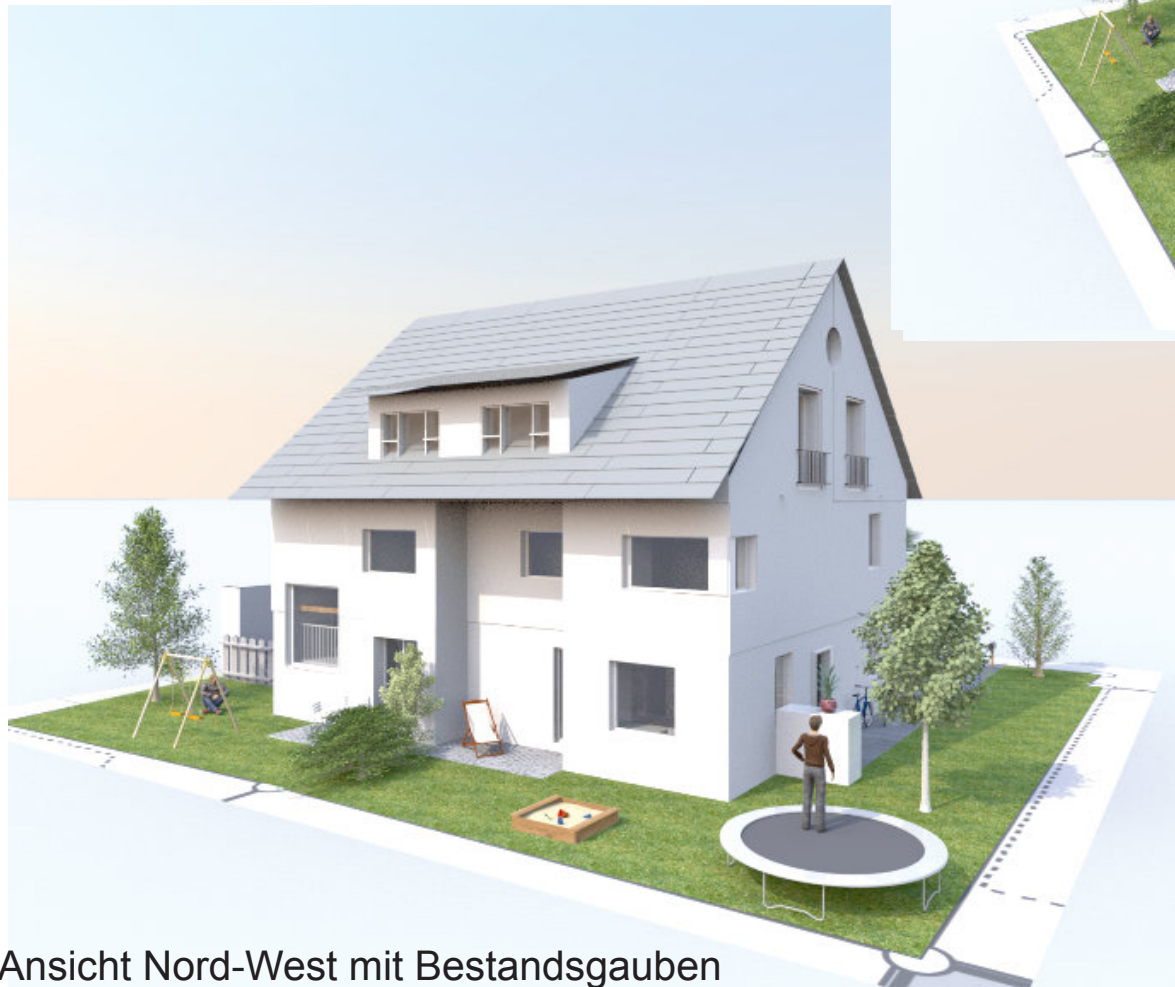
Ansicht Nord-West mit Bestandsgauben

Umbau Bestandsgebäude in 2 DHH Söflingen