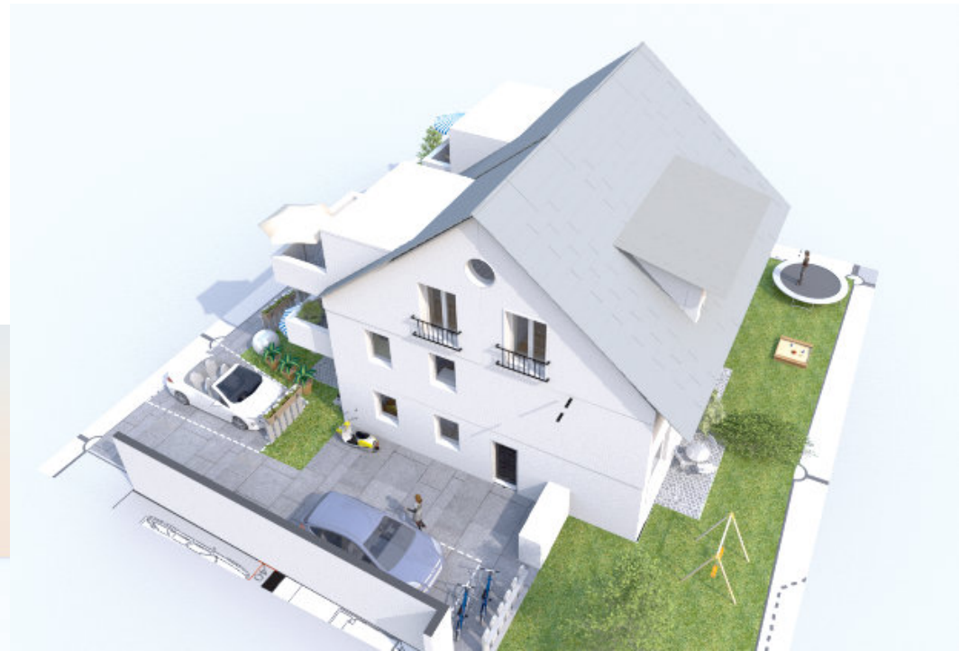
Ansicht Nord-Ost mit neuen Gauben im Süden und Balkonen (in Kostenkalkulation nicht enthalten)